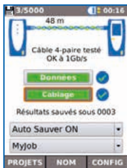
Résultat du test de transmission de donnée