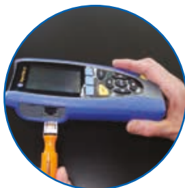
Connecteurs RJ45 remplaçables par l'utilisateur