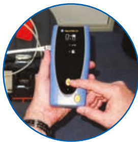
Execution de l'Autotest depuis les deux unités