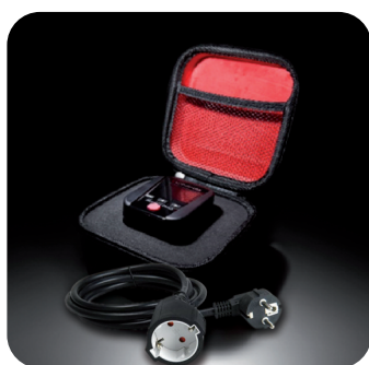
Livré avec étui rigide et prolongateur

Accessoire optionnel : SA165 : kit de mesure pour tableaux électriques