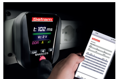
Rapport de test via l'application SEFRAM REPORT (compatible Android et iOS)