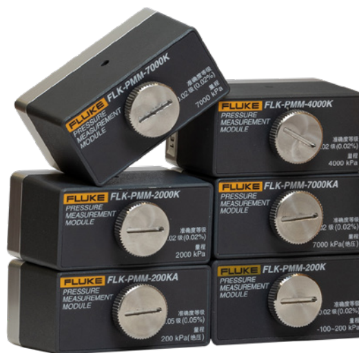
Figure 1. Batterie au lithium rechargeable avec indication de la capacité.

La communication HART permet la compensation de sortie mA, la compensation à des valeurs appliquées et la compensation de pression nulle des transmetteurs de pression HART. Il est facile de modifier l'étiquette d'un transmetteur, les unités de mesure et les plages. D'autres commandes HART prises en charge comprennent la définition de sorties mA fixes pour le dépannage, la configuration de l'appareil de lecture et des paramètres, et le diagnostic de l'appareil de lecture.